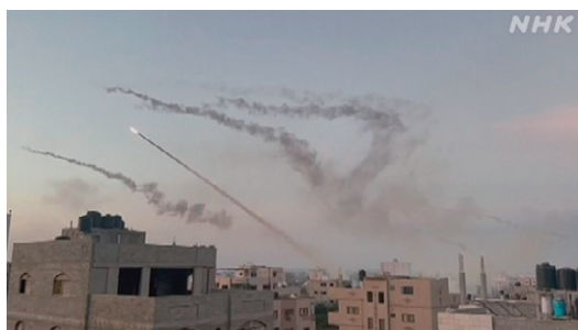
ガザ地区から発射されるロケット弾 Rockets fired from the Gaza Strip

国内の政治的隙を突き、米国が仲介するイスラエルとサウジアラビアの関係正常化を妨害するのが狙いだ」としている。陸海空からイスラエルに侵入する計画は、ハマス単独の立案かは不明だが、イランの精鋭「革命防衛隊」対外工作コッズ部隊幹部とヒズボラ等とハマスは 8 月以降会合を重ねていたとの情報が報道された。この情報についてイスラエルのネタニヤフ首相、ブリンケン国務長官、イスラエルのエルダン国連大使は未確認として慎重な姿勢を崩していない。