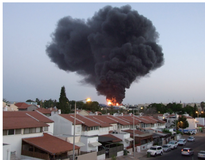
ハマスのものと思われるロケット弾により炎上するイスラエルの家屋 July 8 - August 26, 2014, Israeli house set ablaze by rockets believed to be from Hamas

In the 2012 vote, Hamas announced that it would not participate in the elections, resulting in a vote of confidence for Fatah, the mainstream faction of the Abbas Autonomous Government. No elections were held in Gaza at that time and Hamas took effective control of Gaza. Thus, Palestine was divided between Fatah, which controlled the West Bank, and Hamas, which effectively controlled Gaza.