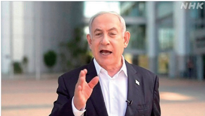
「われわれは戦争状態にある」との声明を出すイスラエル ネタニヤフ首相 Israeli Prime Minister Netanyahu making a statement "We are at war."

これに対しイスラエル側は、ネタニヤフ首相が「われわれは戦争状態にある」とする声明を出して、報復作戦を開始。ガザ地区にあるハマスの拠点などに対して、連日激しい空爆を行った。(2023年10月10日NHK国際ニュースナビより)