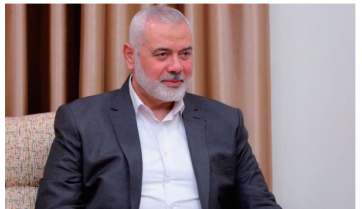
ハマス指導者、イスMAIL・ハニヤ氏。

On Saturday, October 7, 2023, Hamas leader Ismail Haniya said that the Palestinian armed group would expand its fight in the Gaza Strip to the West Bank and Jerusalem. (From ARABNEWS Japan)