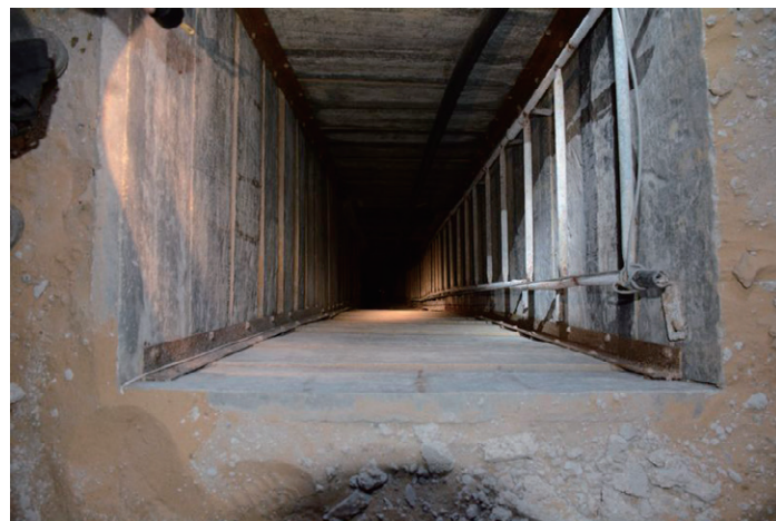
イスラエル軍が発見したガザ地区のトンネル Tunnels in the Gaza Strip that were discovered by the Israeli army