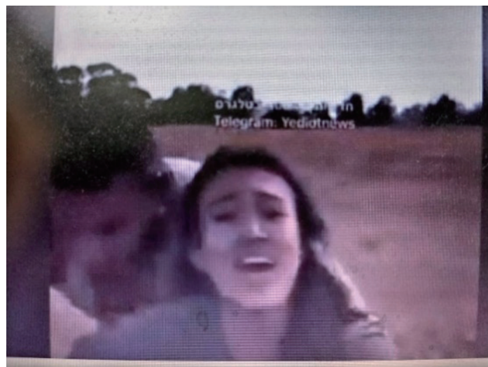
ガザ地区との境界付近で開かれていた野外音楽フェスティバルに参加していた女性が連れ去られる様子（BBC NEWS Japan の動画より） A woman being taken away from an outdoor music festival near the border with the Gaza Strip which she attended. (From BBC NEWS Japan video)