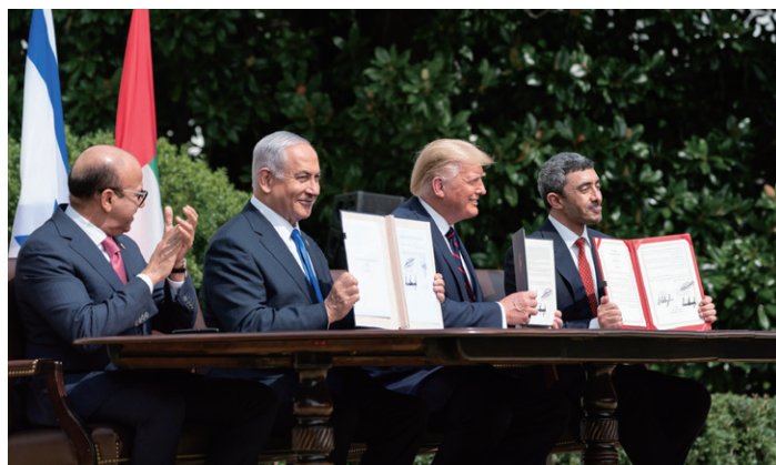
アブラハム和平協定合意：アラブ首長国連邦とイスラエル国間における平和条約及び国交正常化

(左から) バーレーンのザイヤール外相、イスラエルのネタニヤフ首相、アメリカのトランプ大統領、アラブ首長国連邦のアブドゥラー外相